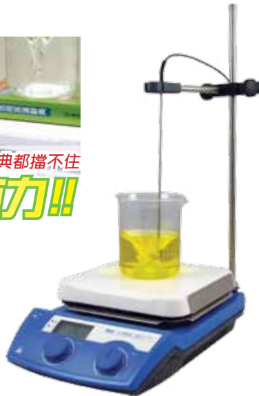
C-MAG HS7 digital