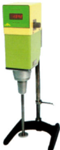
HD-0025RDM 數字式乳化均質機