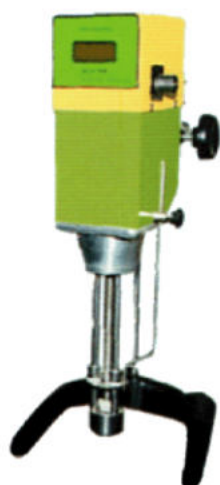
HM-0025RDM 數字式乳化均質機