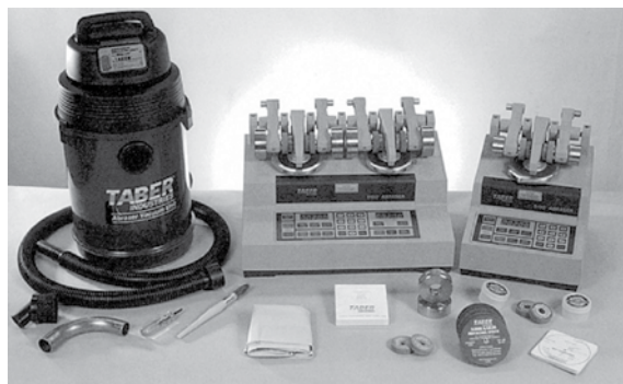
由左至右：真空吸塵器、雙磨輪5155型、單磨輪5135型