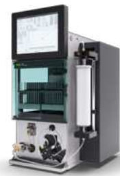
Pure Chromatography Systems 适合您的需求和环境