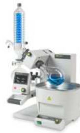
Rotavapor® R-300 方便、高效的旋转 蒸发