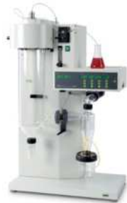
Mini Spray Dryer B-290 全球领先的实验室喷雾 干燥仪