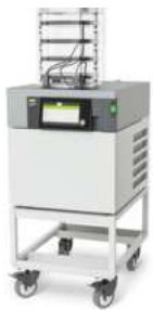
Lyovapor™ L-200 (冷冻干燥机) 首款搭载 Infinite- Control™ 的冷冻干 燥机